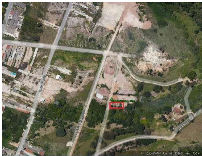
Croqui de localização – EEE 02A Botujuru