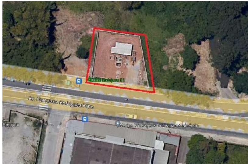
Croqui de localização – EEE 01 Botujuru