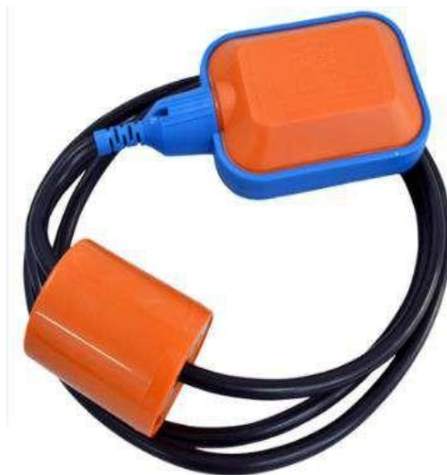
Exemplo de chave-boia

O cabeamento de alimentação e transmissão de sinais dos instrumentos até os painéis deverá ser fornecido pela CONTRATADA.