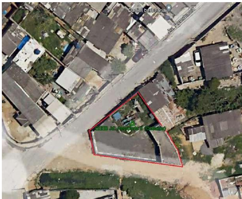
Croqui de localização - EEE Oceania