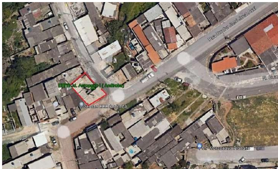
Croqui de localização – EEE Andiroba